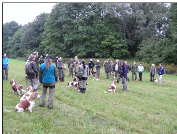
Před zahájením výcviku v sobotu ráno