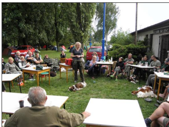
Přednáška o výstavnictví v pátek odpoledne