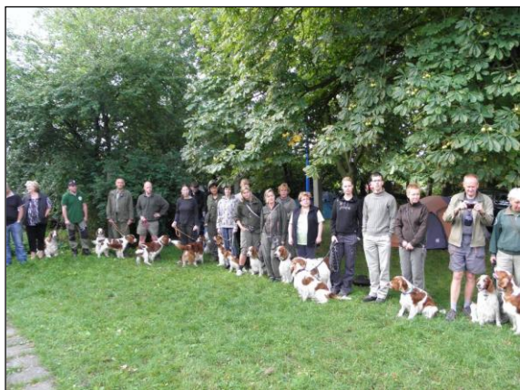
Nástup účastníků srazu WSS 201 v pátek ráno