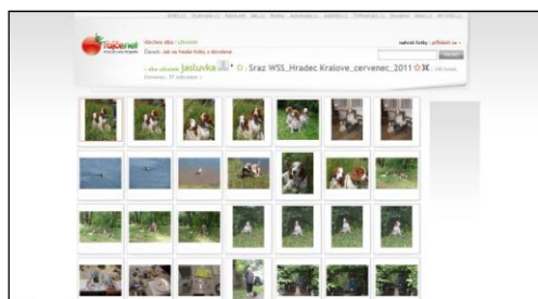
galerie obsahuje 248 fotografií

http://jasluka.rajce.idnes.cz/Sraz_WSS_Hradec_Kralove_cervenec_2011