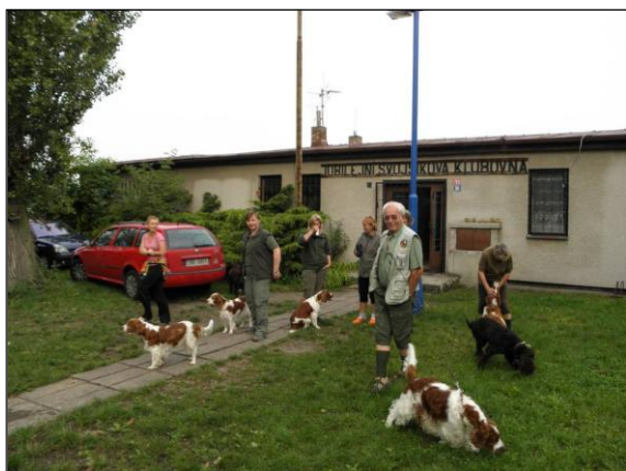
Účastníci srazu před skautskou klubovnou