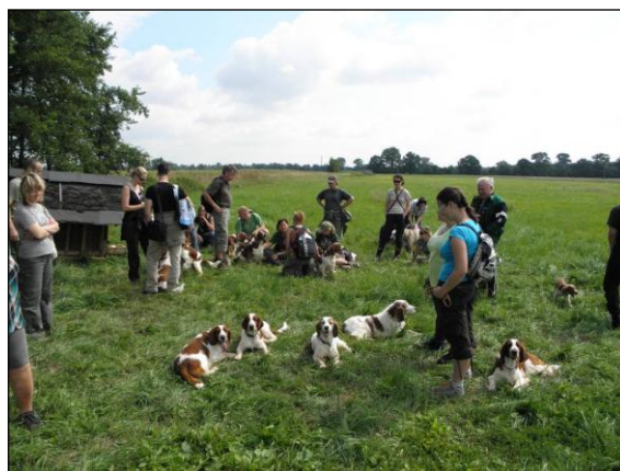
Skupina s mladými a starými psy při pobytu v honitbě