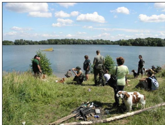
Výcvik vodní práce v pátek odpoledne